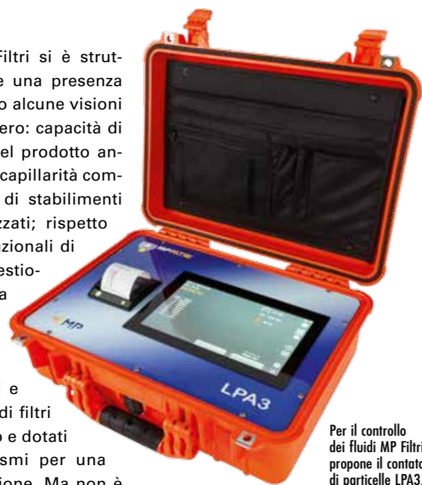
Per il controllo dei fluidi MP Filtri propone il contatore di particelle LPA3.

per il futuro. MP Filtri si è strutturata per garantire una presenza sul mercato secondo alcune visioni della proprietà, ovvero: capacità di personalizzazione del prodotto anche per piccoli lotti; capillarità commerciale; presenza di stabilimenti produttivi delocalizzati; rispetto delle norme internazionali di progettazione, di gestione e controllo della qualità, ambientali; ricerca & sviluppo". L'azienda lombarda offre prodotti sicuri e affidabili, i modelli di filtri sono pratici nell'uso e dotati di alcuni automatismi per una semplice manutenzione. Ma non è tutto. L'impresa si impegna in strategie che riguardano gli investimenti, la ricerca e lo sviluppo di nuovi materiali e prodotti, l'esplorazione e ingresso in nuovi mercati, quali ad esempio il sud-est Asiatico e l'America Latina, o di nuova clientela, quali gli utilizzatori finali nel mercato del post-vendita.