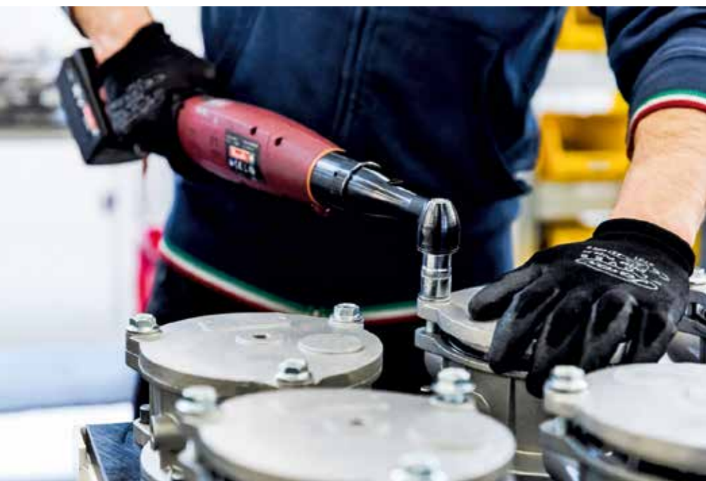
Reparti produttivi dell'azienda. L'automazione, la digitalizzazione dei processi e la tutela ambientale sono sempre più importanti nell'industria manifatturiera.