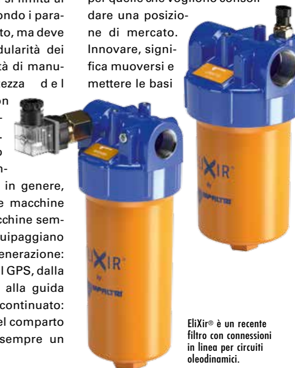
EliXir® è un recente filtro con connessioni in linea per circuiti oleodinamici.

requisito fondamentale sia per le aziende che vogliono crescere sia per quelle che vogliono consolidare una posizione di mercato. Innovare, significa muoversi e mettere le basi